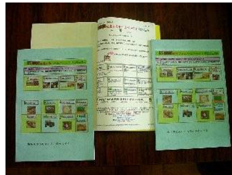
お礼として成長したHPをプリントした冊子が届く