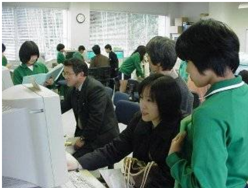
参観日に保護者の方にプレゼンし、評価をもらう

・評価は、メール、TV会議によるインターネット上の評価と共に、参観日に保護者から感想・アドバイスをもろう直接的な評価も取り入れた。