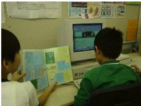
ポートフォリオを見ながら作成

・活動の最後には、これまでの活動を振り返り、ホームページがどう成長したか、また自分自身にどんな力が付いたかを自己評価した。そして、評価をして下さった方たちに感謝の手紙を書いて活動のまとめとした。