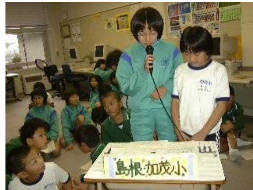
TV会議で交流校にプレゼン・評価

・活動の最後には、これまでの活動を振り返り、ホームページがどう成長したか、また自分自身にどんな力が付いたかを自己評価した。そして、評価をして下さった方たちに感謝の手紙を書いて活動のまとめとした。